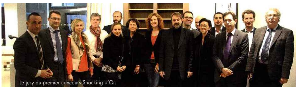
Le jury du premier concours Snacking d'Or.

Les lauréats pourront bénéficier, en plus d'une crédibilité, d'une visite officielle de directions marketing organisée par Elior, d'une mise en rayons chez Carrefour City et Carrefour City Café en région parisienne et d'une mise à l'honneur sur le Sandwich & Snack Show et dans le magazine Points de vente ■