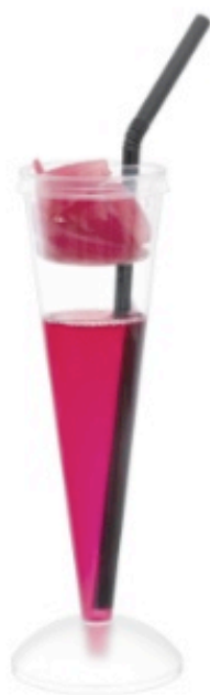
Le Conick, associe liquide et solide.

Carcassonne (11) Cette année, la gamme Cocktail Line de Comatec s'agrandit. A découvrir : le kit Delitub. C'est un tube avec bouchon à remplir de sirop, de coulis, de gelées et qui vous permet de former des billes ou des serpentins. Grâce à cet outil, le professionnel choisit la texture, la saveur, la couleur et la forme de ses préparations. Trois contenances possibles : 7, 15 ou 30 ml, avec grilles de rangement des tubes. Pour étonner toujours et encore, la société vous propose de servir vos cocktails dans un globe ou dans cette éprouvette transparente soulignée d'un filet dépoli qui peut recevoir un couvercle perforé pour le passage d'un chalumeau. Capacité de l'éprouvette : 6 cl. Autre modèle de service : le duo cocktail amuse-bouche de Conik. Dans la coupe, on verse le cocktail (11 cl) et sur son couvercle, on pose le solide. Comatec parle volontiers de créativité débridée pour le barman et de sensation nouvelle pour le consommateur. Deux coloris au choix, cristal ou vert d'eau.