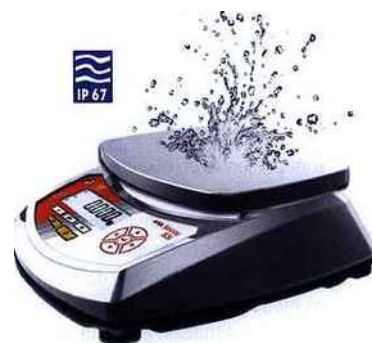
Balance S30-I-15000 de B3C SOEHNLE : Plateau 250 x 197 mm, tout inox IP67, 15 kg/1 g.

Argumenter sur l'intérêt d'une balance au gramme pour économiser de la matière est un constat. Mais, livrer une balance sans tenir compte du centre de gravité de l'utilisateur annule toutes les économies attendues. Le saviez-vous ?