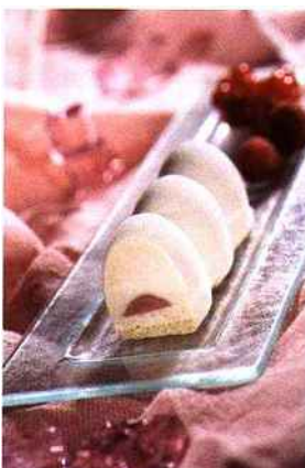
Demarle lance deux nouvelles formes de flexipan, dont la Chenille® réf. 1194.

Deux nouvelles formes, facilement « portionnables », ont été spécialement développées par la société Demarle pour les traiteurs. Il s'agit de L'Annapurna® réf 1184 et de la Chenille® réf. 1194. Idéales pour mouler des mousses, des terrines, ou des cakes, vous pourrez ensuite les détailler à souhait en petits-fours ou taille lunch. Utilisables avec le même support inox, elles vous apporteront un nouveau design sur vos buffets de petits-fours. En nouveauté, vous trouverez également la forme petits fours multi empreintes. Idéale pour obtenir une large variété de petits fours en mousses ou produits cuits en très peu de temps (Référence Flexipan® 1174). Par ailleurs, Thierry Mastain, professeur au Lycée Hôtelier d'Orchies, Pascal Tepper, MOF Boulanger 2000, Frédéric Bourse, l'Atelier del Gusto en Italie, et, Marianne Dufour, Conseillère Technique de Demarle, ont mis tout leur savoir-faire pour vous préparer des recettes sous la forme d'un chevalot dans « Secrets Gourmands, par 4 chefs ».