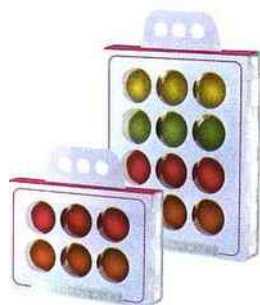
Comatec présente le coffret Macaron Kset qui facilite la présentation, le transport et la dégustation des macarons. Il évite le suremballage, tout en valorisant les macarons. 2 modèles : 6 pièces ou 12 pièces de 45 mm de diamètre dans les alcôves transparentes qui, une fois en main, produisent un bel effet visuel.

Le créateur de vaisselle à usage unique à haute valeur ajoutée, multiplie les nouveautés pour ce printemps-été. Il y a d'abord une ligne naturelle