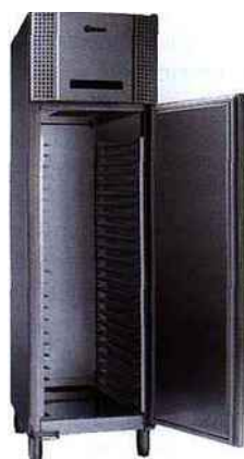
L'armoire réfrigérateur GRAM BAKER M 500.

grâce à une diffusion d'air canalisée et à une fonction froid sec pour les fondants. L'armoire peut recevoir 25 grilles 400 x 600 avec une largeur extérieure de seulement 60 cm. Disponible avec une finition extérieure en inox ou en blanc. Fabriqué au Danemark, cette armoire ne consomme que 0,9 kWh/24 h, soit une économie potentielle d'électricité de 450 € durant sa seule période de garantie constructeur de trois ans.