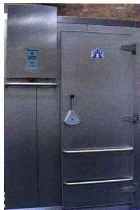
La nouveauté 2011 d'Elboma Koma : la cellule de surgélation et de refroidissement rapide de type Mistral disponible en trois versions 4,7 et 10 CV très compact 166 x 136 x 230 cm (hauteur).