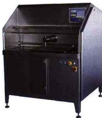
La machine ChefCut spécialement conçue pour les traiteurs qui ont beaucoup de découpes à effectuer sur tous les produits frais ou surgelés, sucrés et salés, à base de fruits, légumes, viandes, poissons, fromages, etc.

Hydroprocess a développé une nouvelle machine de découpe par jet d'eau ChefCut, compacte très innovante, très facile à nettoyer et à utiliser, mise en service en moins