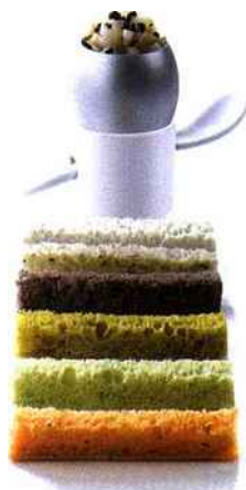
Bridor présente Arc en Ciel, nouvelle collection de pains et de viennoiseries signée Une Recette Lenôtre professionnel.

Colorés, naturels et délicats, les pains Arc en Ciel élargissent l'horizon de la boulangerie en restauration, traiteur et organisation de réception. Inscrite dans la tendance contemporaine, la gamme Arc en Ciel se veut originale, savoureuse, mélangée, naturelle. Support de recettes, Arc en Ciel permet de créer des concepts d'encas de luxe, d'assiettes créatives ou plus simplement de sandwiches chics et colorés. En jouant sur les saveurs des pains, les formes de découpes et les associations avec les ingrédients, Arc en Ciel offre une infinité de possibilités. La palette de couleurs Arc en Ciel couvre un champ étendu de saveurs : marines et iodées - Nori, chaudes et exotiques - Curry, fraîches et relevées - Menthe et ail, méditerranéennes - Tomates confites, parfumées et ensoleillées - Citron confit et thym. Pains sur farine de tradition française, 100 % naturelle, sans ajouts de colorants. Texture fine et légère.