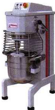
BT20F de Caplain Machines.

Depuis 1947, Caplain Machines développe de larges gammes de matériel destinées au secteur des métiers de bouche.