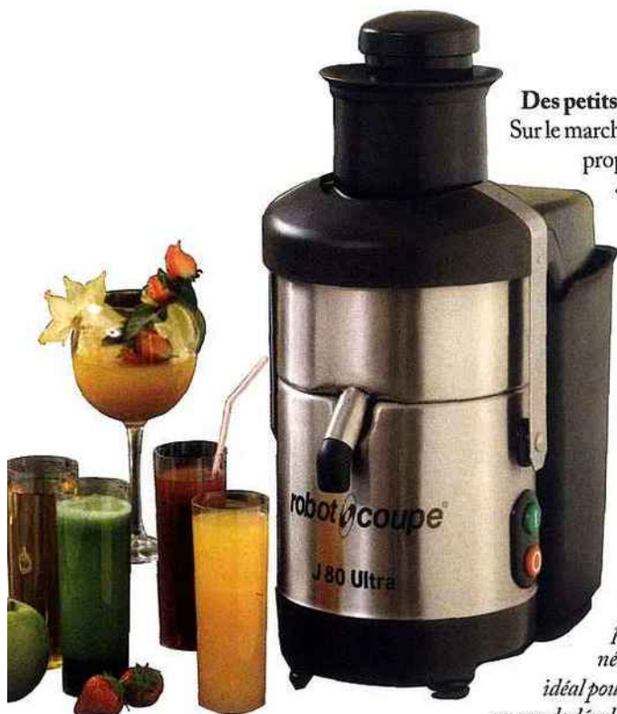
La centrifugeuse J80 de Robot Coupe répond à la demande croissante de consommation de fruits et de légumes frais.