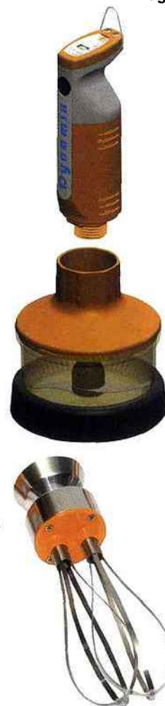
Dynamix de Dynamic (ici avec batteur et hachoir) est le plus petit mixer professionnel avec pied démontable.

Quant à Kenwood, la marque présente le Cooking chef. Véritable « tout en un », il se compose d'un robot Major de la ligne Titanium (1500 W), doté d'une cuisson par induction (1100 W). La capacité de son bol pour le froid est de 6,7 l et pour le chaud de 3 l. Le Cooking chef aide à tout préparer en un tour de main. Son minuteur à affichage digital permet de gérer le temps et la température. Le thermostat varie de 20 ° à 140 °. La cuisson induction est affichée au degré près. Au chapitre des accessoires, le Cooking chef peut être équipé